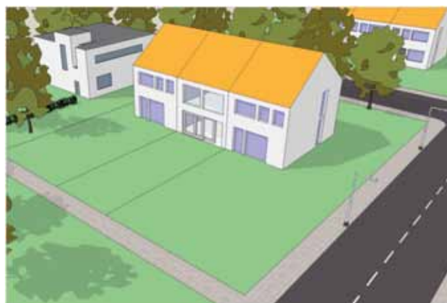
Aan de achterzijde mag de gevelindeling zonder omgevingsvergunning worden gewijzigd, in dit geval aan de zijgevel niet.

Belangrijk is waar u uw kozijn of gevelpaneel wilt veranderen of waar u een kozijn wilt plaatsen. In de regel geldt dat alles wat grenst aan openbaar toegankelijk gebied (de weg, openbaar groen of water), zoals de voorkant en bij hoekwoningen de zijkant van de woning, een grotere invloed heeft op de directe omgeving dan